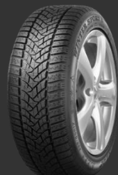
Winter Sport 5