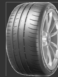
Sport Maxx Race 2