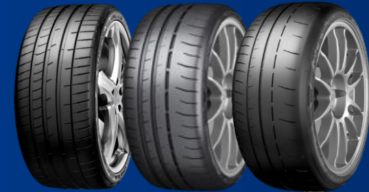
Eagle F1 SuperSport, R, RS