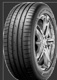
Sport Maxx RT2 SUV