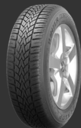
Winter Response 2