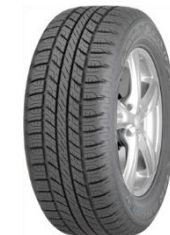
Wrangler HP All Weather