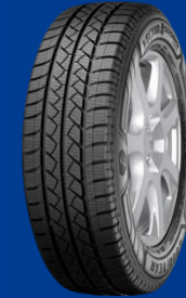
Vector 4Seasons Cargo