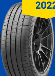
Eagle F1 Asymmetric 6