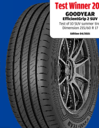
EfficientGrip 2 SUV