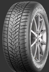
Winter Sport 5 SUV