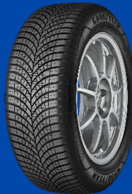
Vector 4Seasons Gen-3