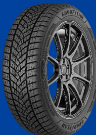
UltraGrip Performance+ SUV