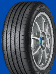
EfficientGrip Performance 2