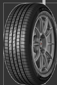
Sport All Season