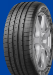
Eagle F1 Asymmetric 5 SUV