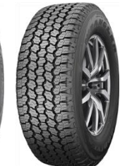
Wrangler All Terrain Adventure