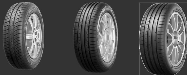
Sport BluResponse Sport BluResponse Sport Maxx RT2